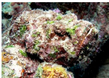
Akmenszivs Synanceia verrucosa

Daļa organisma, kas atgādina kuģa _____, peld virs ūdens, tā taustekļi, kuros ir indīgas dzelējšūnas, ūdenī notver medījumu.