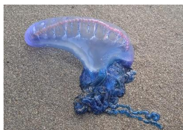
Portugāles kuģītis jeb fizālija _____

Organismu grupa, kurā dažas sugas kož tikai aizsargājoties, bet citas indi aktīvi izmanto, lai barojoties _____ medījumu.