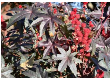
_____ Ricinus communis

Daži šīs grupas organismi barojas ar hidrozojiem, absorbē to dzelējšūnas un tās iekļauj savā ķermenī.