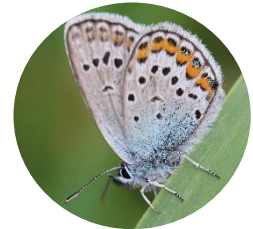
Mazais viršu zilenītis