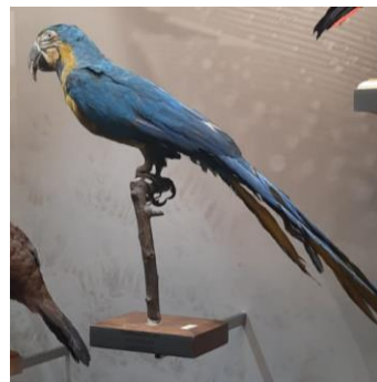
Dzeltenzilais jeb zildzeltenā ara